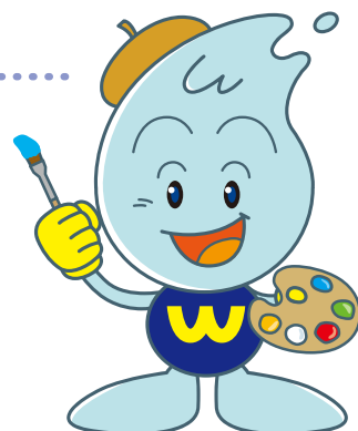
仙台市水道局キャラクター ウォーターくん

*サイズ：A4 または 6 つ切りサイズ *単写真、未加工のもの（合成や不要部分の削除等をしていないもの）