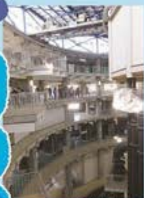
茂原浄水場の見学