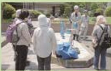
災害時の応急給水体験