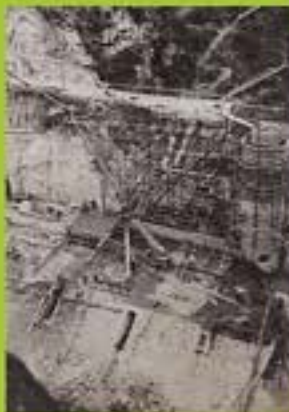
建設中の青下第一ダム

※給水開始当時の仙台市の人口は約11万8000人、給水人口は約2万6000人、水道普及率は約21%でした。