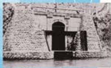
大瀬川の取水口。1913(大正2年)年から始まった水道創設工事につくられました。