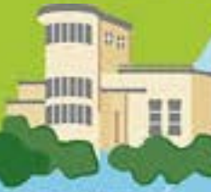
青下ダム旧管理事務所