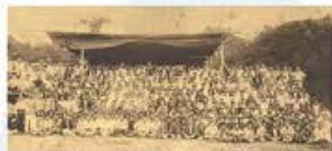
青下ダムの工事で働いた方々。たくさんの方にご尽力いただきました。