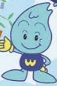
水道局キャラクター ウォーターくん

仙台の水道管路の総延長は、現在約3400km。仙台と鹿兒島の往復程の長い距離ですが、そのルーツは伊達政宗公がつくった約44kmの四ツ谷用水でした。それでは一緒に、「水の道」のルーツをたどる時間旅行へ。