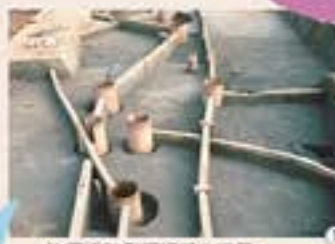
汐留遺跡発掘現場の様子

今から約25年前、発掘調査が始まった東京の汐留で、江戸大名屋敷跡から、上水(水道)遺構が見つかりました。木桶や、水道管にあたる木桶などが発掘され、江戸時代の水事情を知るための貴重な資料となっています。