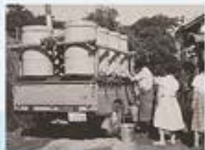
夏季の深刻な水不足に、市内を給水車が駆けめぐりました。