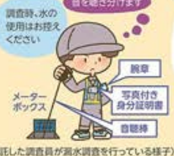
(委託した調査員が漏水調査を行っている様子)