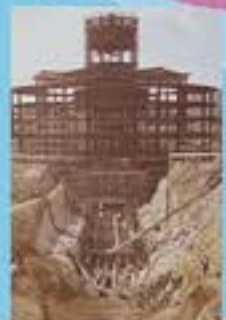
建設中の茂庭浄水場。現在仙台市内で1番大きな浄水場です。