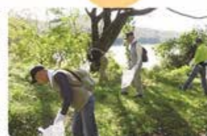
お客さまと行っている釜房ダム湖群の清掃活動

自然の贈り物である雨水を、貯めてきれいにしてくれるのが森林です。仙台市水道の水源の一つ、青下水源地では、いつもおいしい水を供給できるように、約86haもの広さの水源遊歩道を保全・管理しています。また釜房ダムや大倉ダム、青下ダムでは、お客さまや企業の方と一緒に湖群清掃を行うなど連携して水源保全に取り組んでいます。