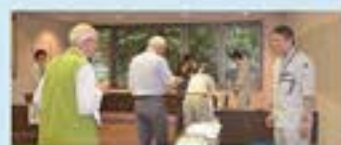
きき水体験の様子