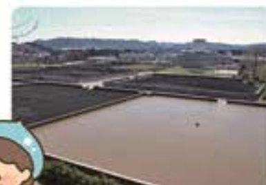
茂庭浄水場天日乾燥床

浄水場で水道水をつくる過程で取り除かれた沈殿物を集め、天日乾燥や機械脱水処理したものを「浄水発生土」といいます。水道局ではこの浄水発生土を、建設改良土や園芸用土、セメント原料などに再利用することで100%有効活用しています。