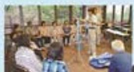
災害時の応急給水体験の様子