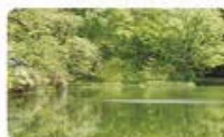
青下水源遊歩道の保全

自然の贈り物である雨水を、貯めてきれいにしてくれるのが森林です。仙台市水道の水源の一つ、青下水源地では、いつもおいしい水を供給できるように、約86haもの広さの水源遊歩道を保全・管理しています。また釜房ダムや大倉ダム、青下ダムでは、お客さまや企業の方と一緒に湖群清掃を行うなど連携して水源保全に取り組んでいます。